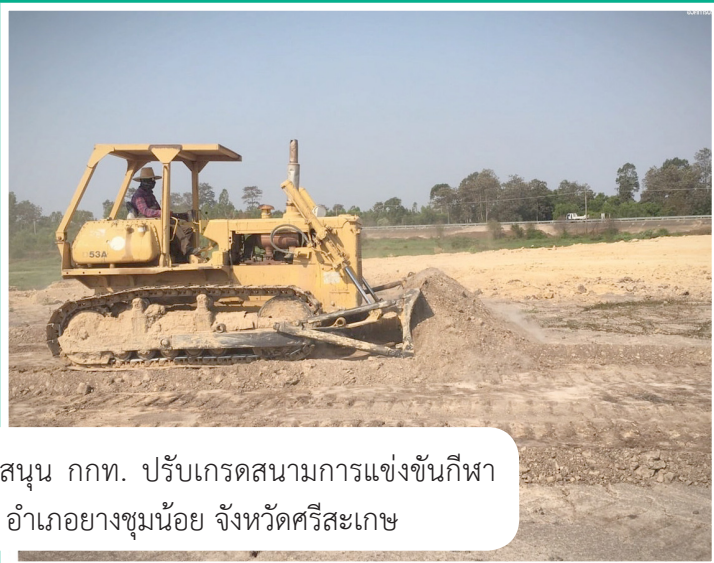
ลงพื้นที่ดำเนินการ สนับสนุน กทท. ปรับเกรดสนามการแข่งขันกีฬา ทางอากาศ ณ สนาม อบต.ลิ้นฟ้า อำเภอยางชุมน้อย จังหวัดศรีสะเกษ