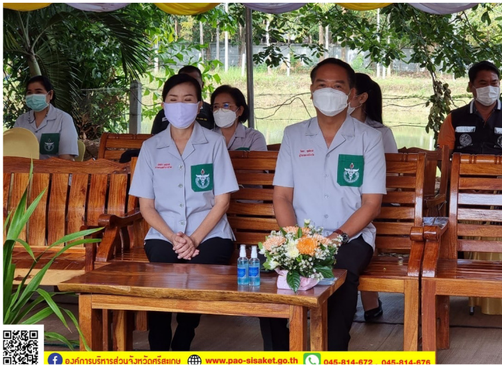
องค์การบริหารส่วนจังหวัดศรีสะเกษ | www.pao-sisaket.go.th | 045-814-672, 045-814-676

สำหรับภารกิจออกหน่วยบริการจังหวัดเคลื่อนที่ จังหวัดศรีสะเกษ ประจำปีงบประมาณ 2565 เป็นโครงการที่จังหวัดศรีสะเกษกำหนดจัดขึ้นทุกเดือน โดยนำส่วนราชการออกให้บริการประชาชนในด้านต่าง ๆ รับทราบปัญหาในพื้นที่ เพื่อให้ความช่วยเหลือประชาชนได้ทันทั่วถึง และตอบสนองความต้องการของประชาชนได้ถูกต้อง