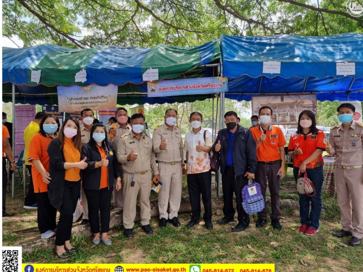
องค์การบริหารส่วนจังหวัดศรีสะเกษ | www.pao-sisaket.go.th | 045-814-672, 045-814-676